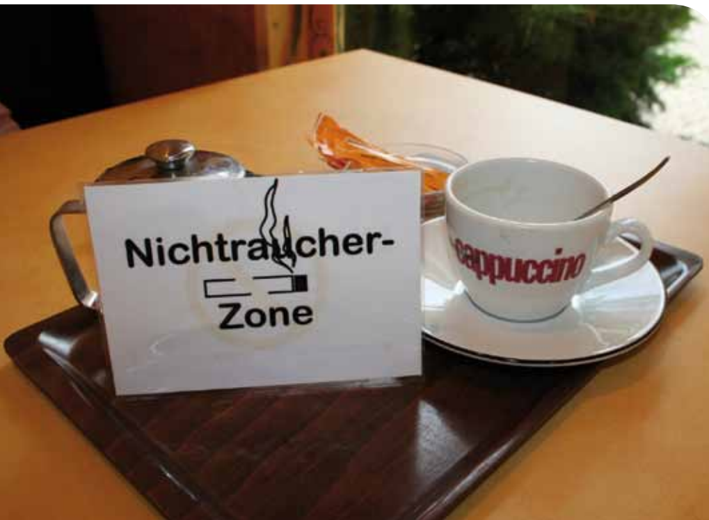
Frischluff statt Zigarettenqualm. Das Rauchverbot setzt so manchen Gastwirt auf die Straße.