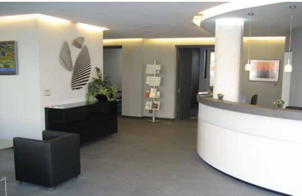
Eingangs- und Empfangsbereich. Moderner Look und noch mehr Service für unsere Mandanten

TEXT: Sören Riebenstahl, Fachanwalt für Arbeitsrecht